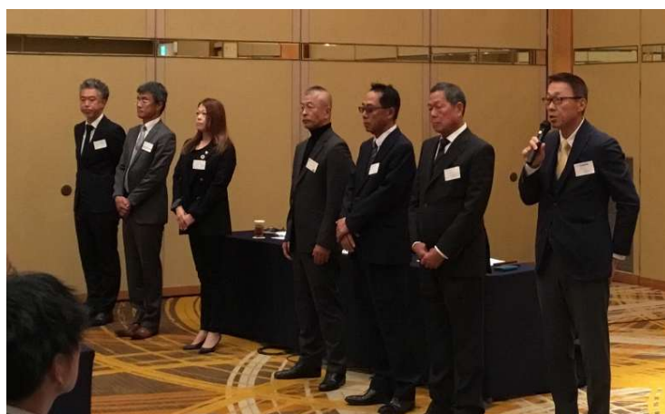
選任された理事によるご挨拶

また、組合の理事・監事の任期が今通常総代会終結時までとなっていたため、第5号議案において役員の改選をおこないました。