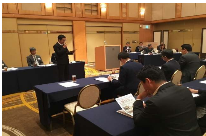
レクリエーション報告の様子 （レクリエーション詳細は4ページ目にてチェックできます！）

議案については、全議案賛成多数で可決されました。ご多用の中、ご来賓の方々をはじめ、理事、総代の方々等、大勢の方にご出席を賜り無事に開催、終了できましたこと、厚く感謝申し上げます。